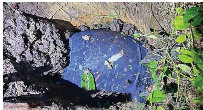
Serpihan logam didapati terbenam kurang satu meter dalam tanah.