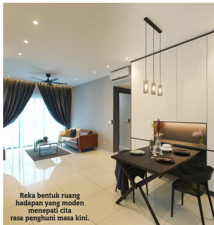
Reka bentuk ruang hadapan yang moden menepati cita rasa penghuni masa kini.