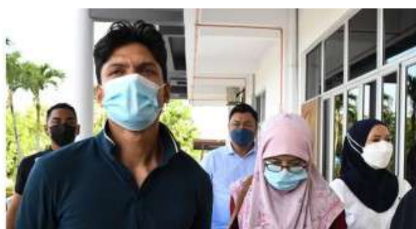
Suami isteri dihadapkan ke mahkamah miliki 53 kep...