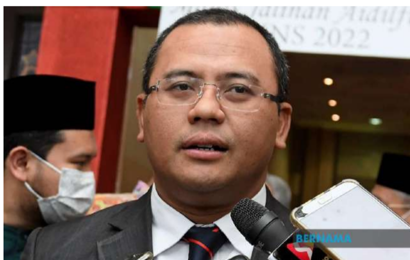
Selangor sedia hantar bantuan kepada mangsa banjir di Baling