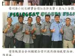
雪州副副州長邱志博(左)與許東賢(右)合影。

【巴生訊】雪州減塑運動最後一站來到巴生巨港社區，雖然獲得許多民眾及社會團體給予支持。 雪州副副州長邱志博指出，雪州減塑活動是環保減塑活動，能發揚許多人民愛護環境、學習環保知識、學習環保知識。