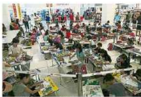
上述這些比賽獲得熱烈響應，吸引逾400名市民參與。