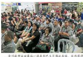
雪州減塑活動最後一站來到巴生巨港社區，雖然獲得許多民眾及社會團體給予支持。