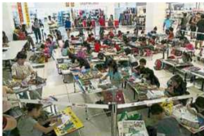
兒童填色比賽獲得熱烈響應，吸引逾60名學生參與。