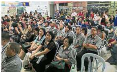
雪州減塑運動最後一站來到巴生巨盟批發城，依然獲得許多民眾及社會團體給予支持。