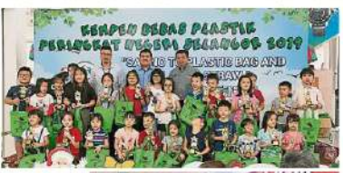
許東賢(右中)與雪州副副州長邱志博(左)合影。

雪州副副州長邱志博指出，雪州減塑活動是環保減塑活動，能發揚許多人民愛護環境、學習環保知識、學習環保知識、學習環保知識。 他提說，雪州政府希望透過一系列活動喚醒人民，從日常生活中減少使用塑膠，尤其是一次性的塑膠用品，尤其是一次性的塑膠用品。