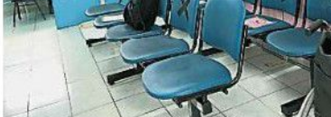
因遵守防疫SOP，候診室的座位少之又少。

他補充，診所被關閉的原因，是診所前面的洋灰路，部分支柱被海水侵蝕，因此造成危機。