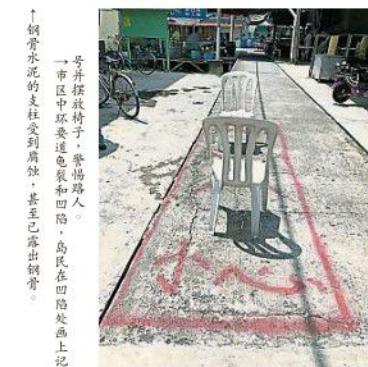
↑鋼骨水泥的支柱受到腐蝕，甚至已露出鋼骨。→市區中環受過龜裂和四陷，島民在四陷處畫上記