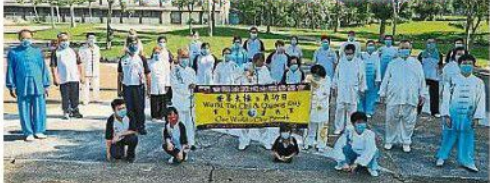
吉隆坡陳式太極拳協會舉辦“世界太極日”活動。